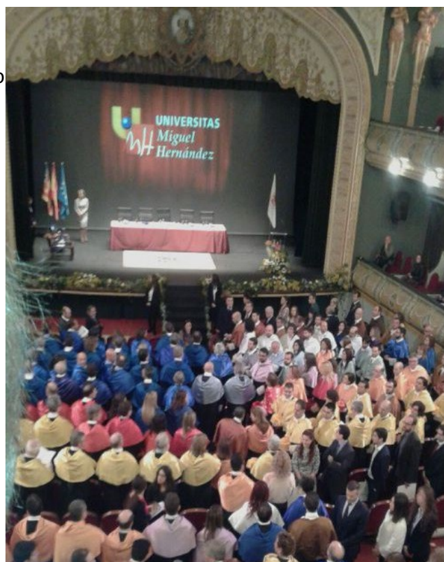
Foto: Asistentes a la ceremonia en el Gran Teatro