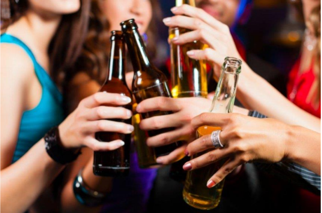
Foto: jóvenes de fiesta.

¿No es más cierto que bebemos más por costumbre que por gusto?